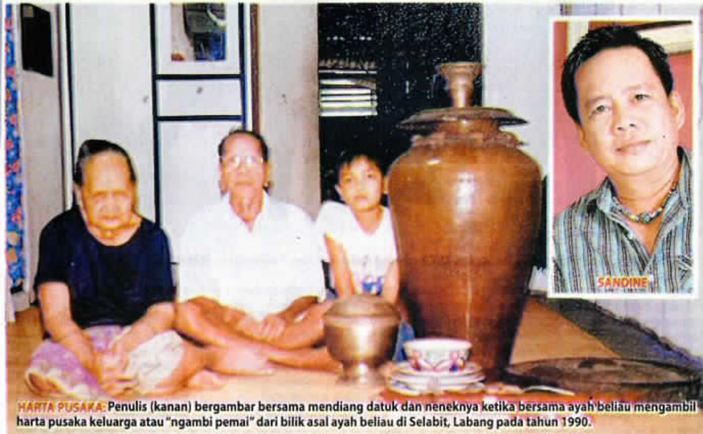
HARTA PUSAKA: Penulis (kanan) bergambar bersama mendiang datuk dan neneknya ketika bersama ayah beliau mengambil harta pusaka keluarga atau "ngambi pemai" dari bilik asal ayah beliau di Selabit, Labang pada tahun 1990.