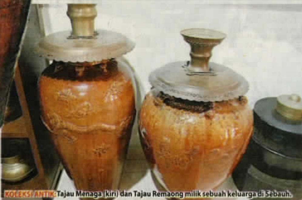
KOLEKSI ANTIK: Tajau Menaga (kiri) dan Tajau Remaong milik sebuah keluarga di Sebauh.

Dalam pada itu pula, kaum Iban pada masa itu terutamanya golongan lelaki dewasa memperoleh tajau dengan mengembara atau "belelang" ke tempat lain seperti Brunei, Kalimantan atau